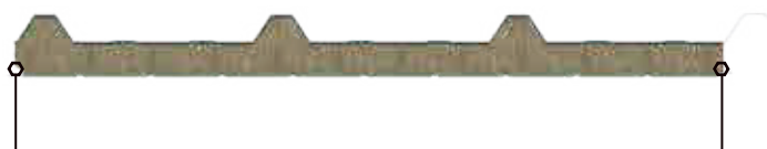
Diseño con ancho útil 1,00 metro.

Panel en núcleo de lana de roca mineral (LRM) con recubrimiento en ambas caras de acero galvanizado prepintado. Fabricado en proceso de línea continua, es ideal para cubiertas y fachadas de edificaciones.