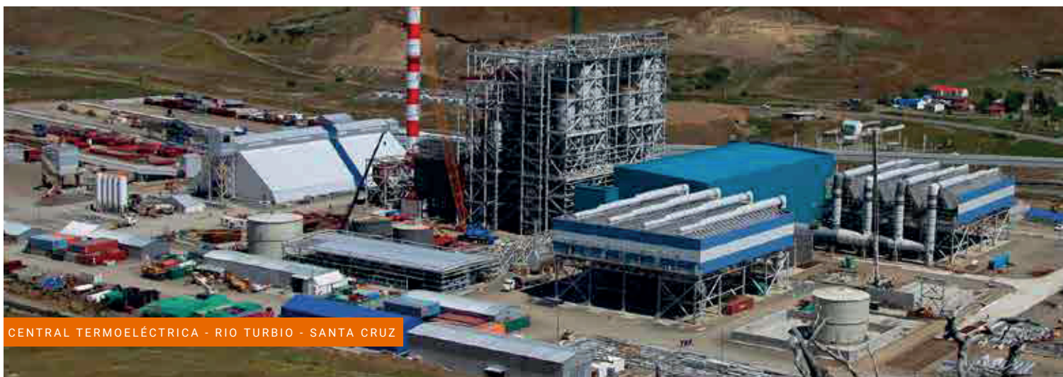
CENTRAL TERMOELÉCTRICA - RIO TURBIO - SANTA CRUZ

Permite suprimir la instalación de cielorrasos u otros tipos de acabados.