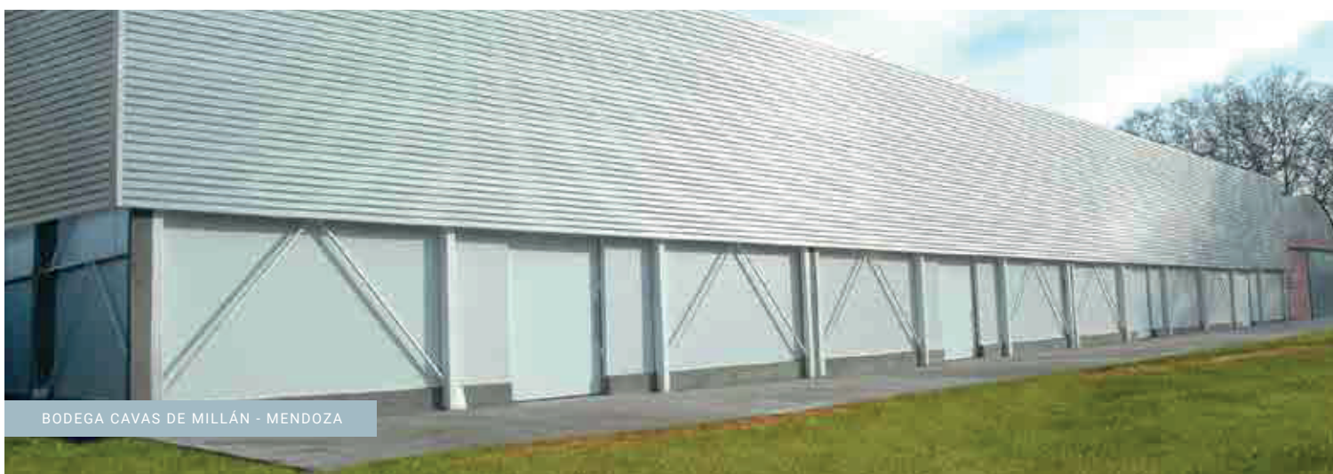
BODEGA CAVAS DE MILLÁN - MENDOZA

Elevada resistencia mecánica con posibilidad de mayor separación entre apoyos.