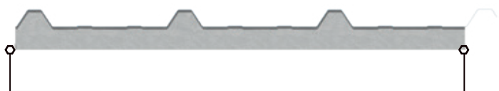
Diseño con ancho útil 1,00 metro

Panel con núcleo de poliestireno expandido (EPS) de alta densidad con recubrimiento en ambas caras de acero galvanizado prepintado. Fabricado en línea continua, es ideal para el uso de cubiertas en general, tanto industriales como residenciales.