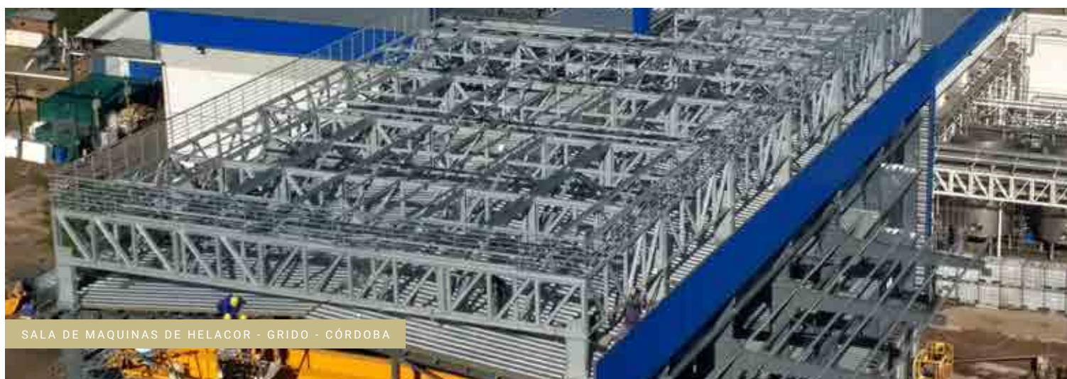
SALA DE MAQUINAS DE HELACOR - GRIDO - CÓRDOBA