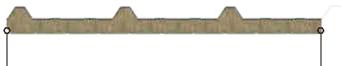
Diseño con ancho útil 1,00 metro.

Panel en núcleo de lana de roca mineral (LRM) con recubrimiento en ambas caras de acero galvanizado prepintado. Fabricado en proceso de línea continua, es ideal para cubiertas y fachadas de edificaciones.